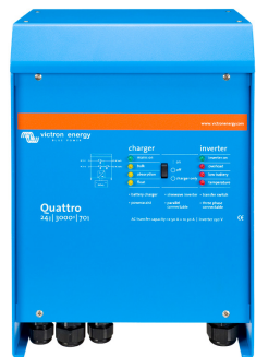
Quattro 24 3000 70