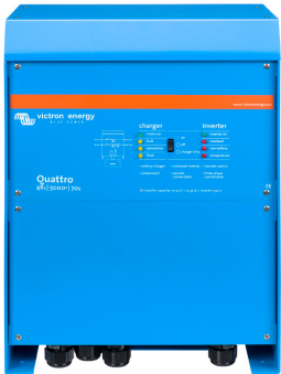
Quattro 48 5000 70