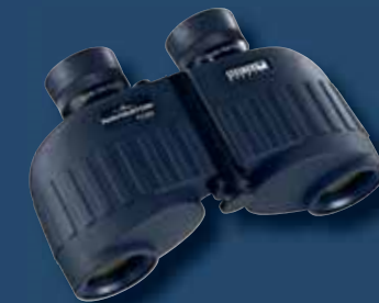
Navigator 7x30 ohne Kompass

Alle weiteren technischen Features sind identisch mit der Kompass-Version.