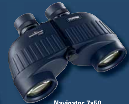
Navigator 7x50 ohne Kompass

Alle weiteren technischen Features sind identisch mit der Kompass-Version.