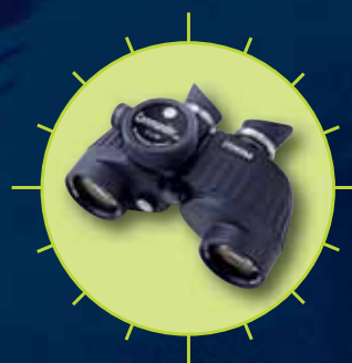
Commander XP 7x50

Die neue Generation! Professionelle Marine-Ferngläser vom Weltmarktführer.