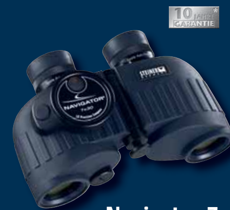
Navigator 7x30 mit Kompass