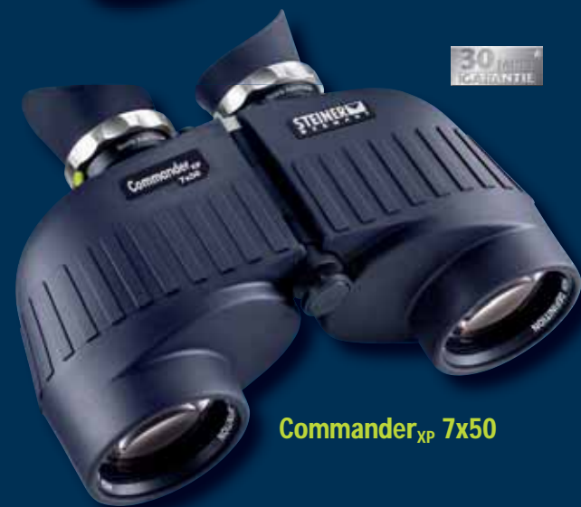
Commander XP 7x50